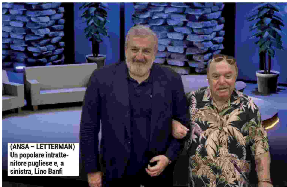
Un popolare intrattenitore pugliese e, a sinistra, Lino Banfi