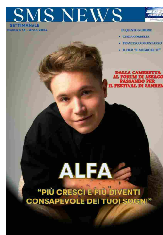
SMS NEWS NUMERO 13 ANNO 2024