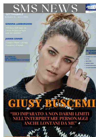
SMS NEWS NUMERO 14 ANNO 2024