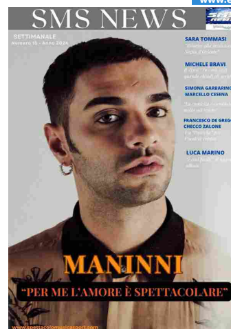
SMS NEWS NUMERO 15 ANNO 2024

"In un momento così drammatico, in cui sembra di essere ritornati indietro di secoli con scenari apocalittici di epidemie, guerre e carestie, non dovremmo preoccuparci solo di ciò che abbiamo sbagliato, ma di quanto è