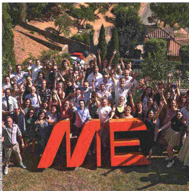
Mostra Artigianato e Palazzo 89

Dove Piazza Quercia / Info dialoghiditrani.com ▲