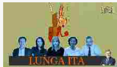
Metropolis/399 - "Lunga Ita". Perché

Vulcanico, ironico, fustigatore di accademici e politici. Fiorello