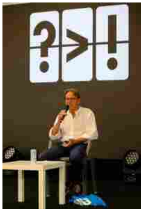
Festival della Comunicazione

Clicca sul link e metti un mi piace sui ns social Instagram e Facebook