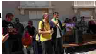
Orsa Amarena, a Pescina oltre mille persone in corteo