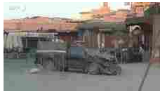
Terremoto in Marocco, edifici distrutti nella Medina di Marrakech