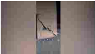
Terremoto in Marocco, strade ricoperte di macerie ed edifici distrutti

Voia Festival letteratura, 65mila presenze in 5 giorni