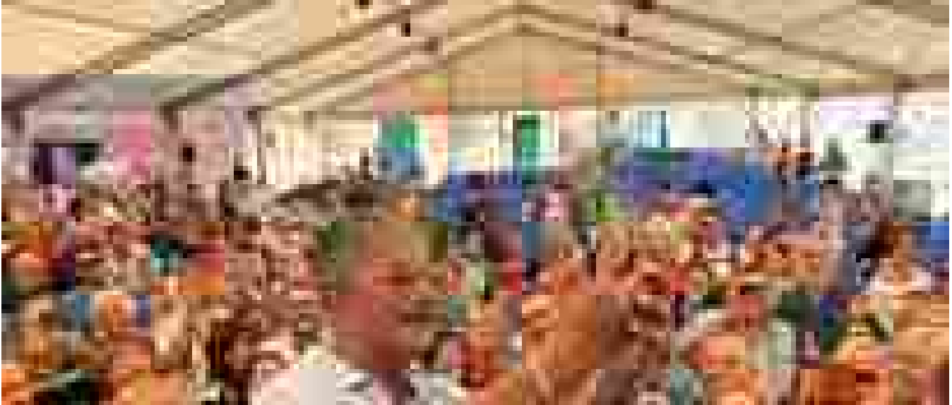
Florello show a Camogli tra Meloni, Spalletti e Sanremo