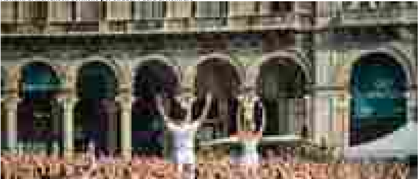
Bolle fa lezione Duomo, 'la danza è maestra di vita'