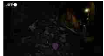
Sisma in Marocco, abitanti di Marrakech dormono per strada: "Paura di tornare a casa"