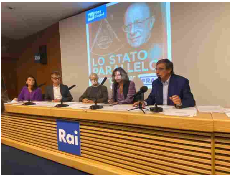
Festival della Comunicazione, un novembre ricchissimo di appuntamenti Tre prestigiosi eventi all'interno di Bookcity