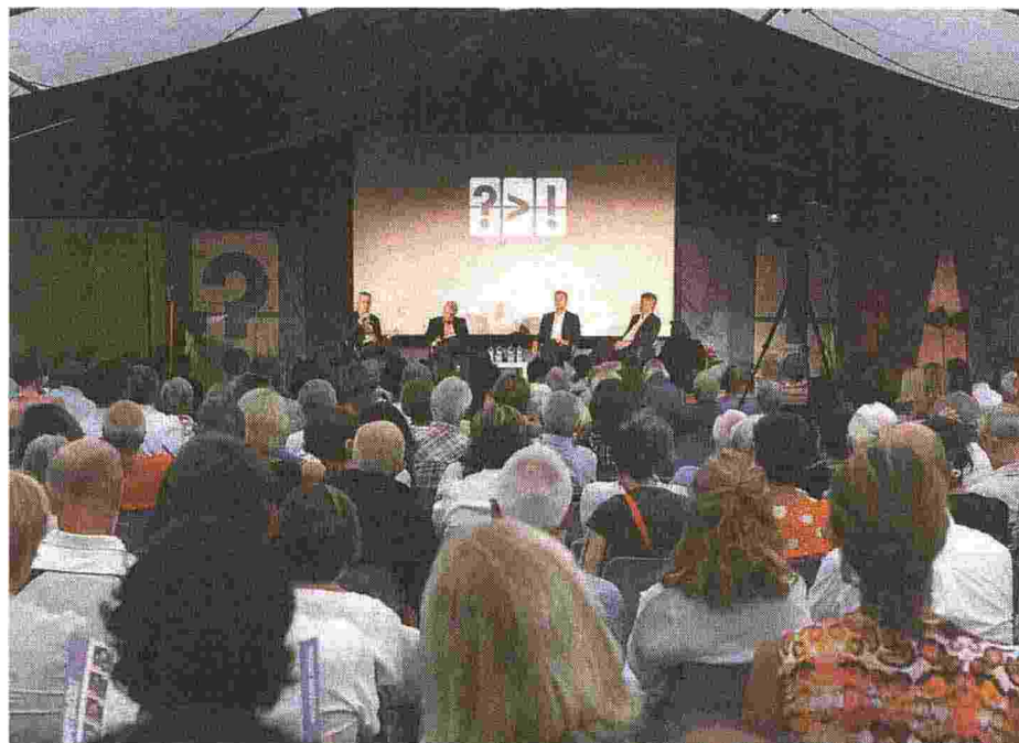
Un momento di una passata edizione del Festival della Comunicazione di Camogli (Genova)