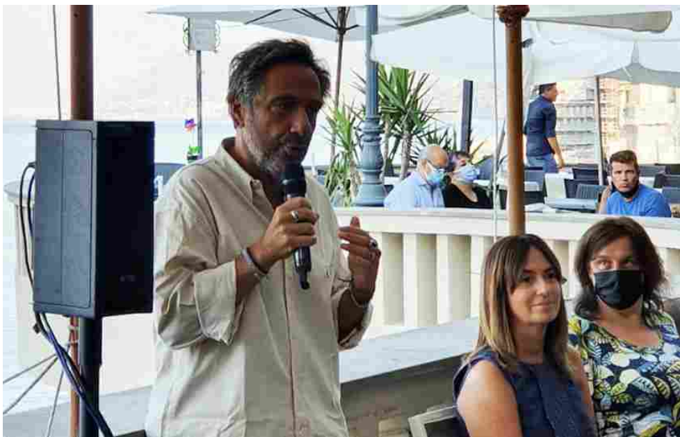
Il geologo Mario Tozzi al Festival della Comunicazione di Camogli

È il geologo Mario Tozzi a meritare il massimo riconoscimento alla prima edizione nazionale del “Premio Sostenibilità Ambientale”, istituito nel 2021 dal Comune di Camogli e dall'Istituto Cardiovascolare di Camogli insieme al Festival della Comunicazione per premiare personalità, istituzioni, elaborati e lavori che si sono distinti in favore dello sviluppo sostenibile della nostra società, rispettando gli equilibri naturali dell'ecosistema.