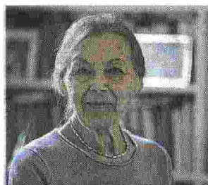
Edith Bruck

Anche in tutta Italia numerose le iniziative. Tra queste, la celebrazione ufficiale al Ministero dell'Istruzione oggi dalle 11 (diretta su Rai Uno) col ministro Patrizio Bianchi e la presidente dell'Unione delle comunità ebraiche italiane Noemi Di Segni. E domani il Viaggio della Memoria per i giovani delle scuole, che sarà