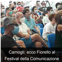
Camogli: ecco Fiorello al Festival della Comunicazione