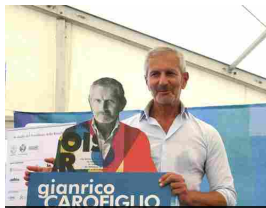
Camogli: Festival della Comunicazione, segnale...