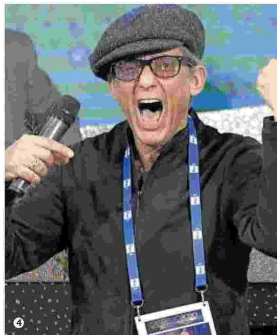
Ultimo giorno a Camogli del Festival della Comunicazione con protagonisti 1. Giusy Versace, 2. Piergiorgio Oddifreddi 3. Claudio Bisio 4. Rosario Fiorello riceverà il Premio Comunicazione 2020