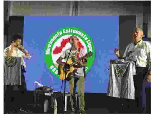
FESTIVAL Fiorello con Pierluigi Pardo, Andrea Di Marco e in basso Claudio Bisio