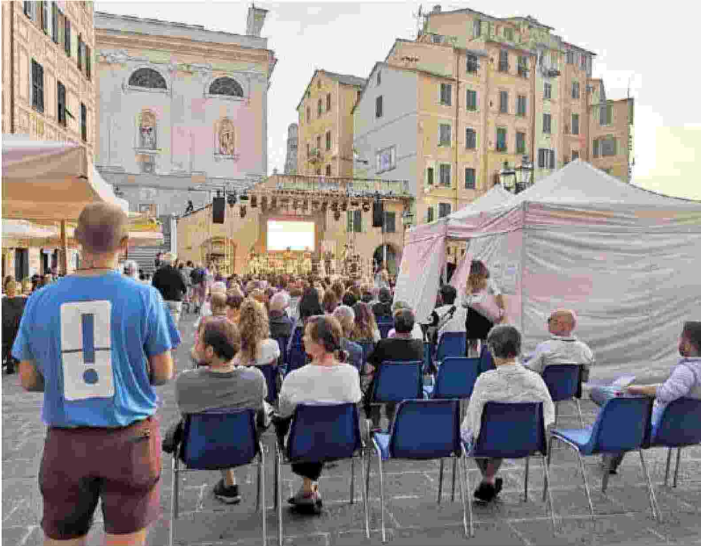
Camogli si prepara alla settima edizione del Festival della Comunicazione