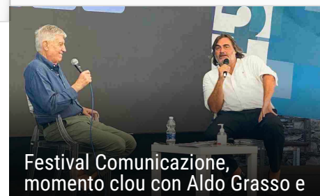
Festival Comunicazione, momento clou con Aldo Grasso e Pierluigi Pardo