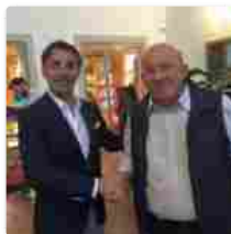
Presentato il Distretto turistico Sud Est Sicilia al Festival del cinema di Venezia