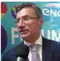
Engie, un fondo da 100 mln per start-up tecnologiche e green