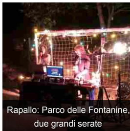
Rapallo: Parco delle Fontanine, due grandi serate