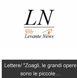
Lettere/ "Zoagli, le grandi opere sono le piccole..."