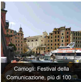
Camogli: Festival della Comunicazione, più di 100...