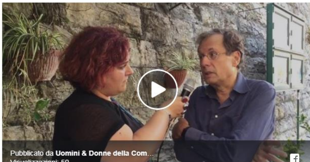
Il filosofo Maurizio Ferraris