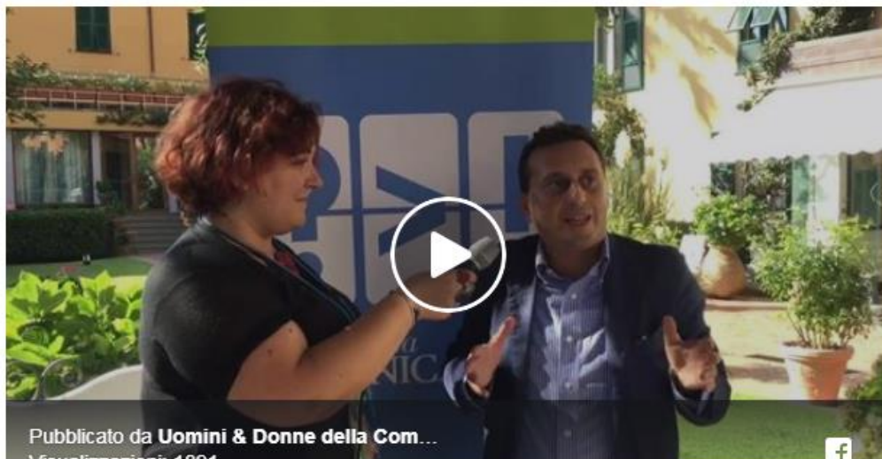
Il giornalista David Parenzo