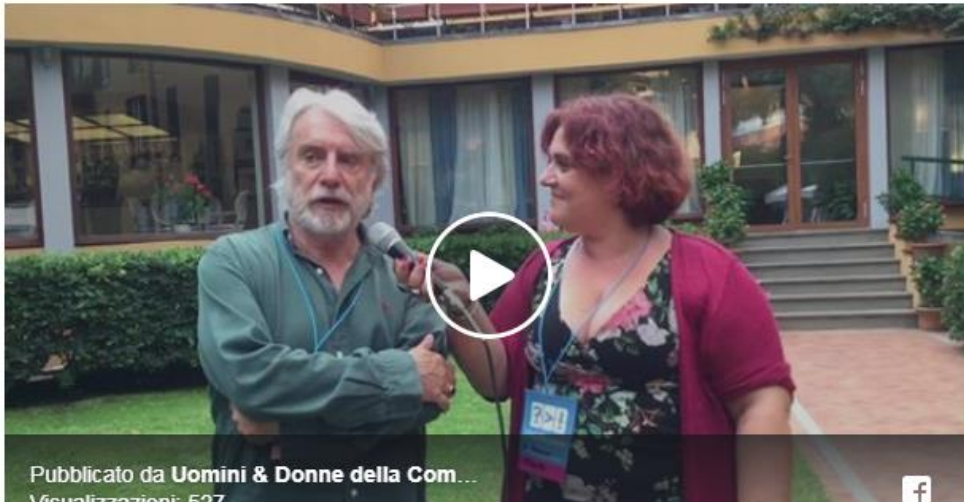
Lo psichiatra Paolo Crepet