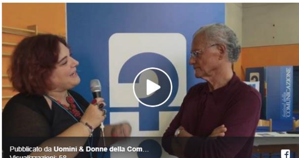
Il semiologo Paolo Fabbri