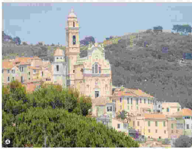
1. Passeggiate culturali al Castello di San Giovanni a Finalborgo; 2. Ad Albisola si svolge una gara di «Master Ceramisti»; 3. A Orto Maccagli di Loano si esibisce il complesso «Quelli degli Anni Sessanta»; 4. Penultimo appuntamento con le visite guidate estive al centro storico di Cerveto