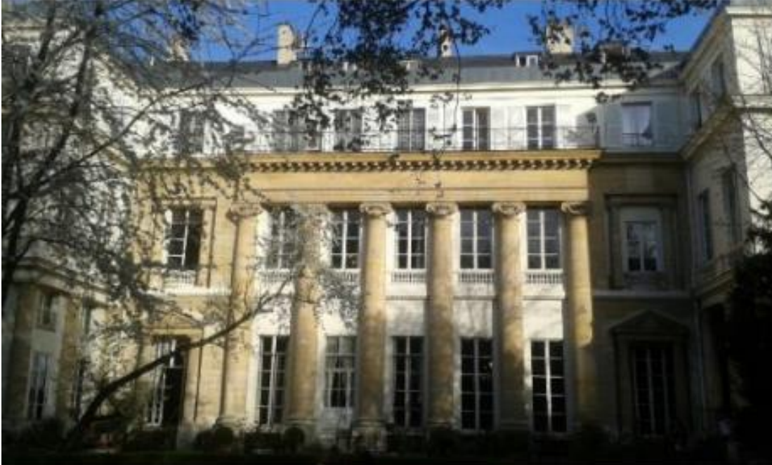
La sede dell'Istituto Italiano di Cultura