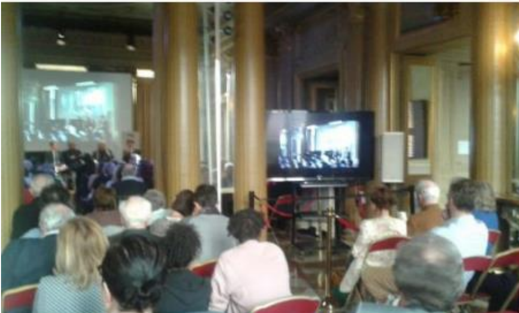
L'incontro seguito anche su schermo