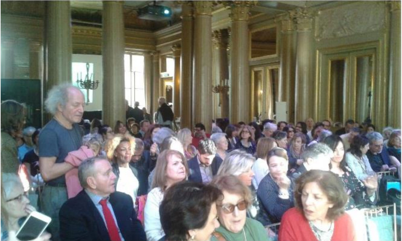
Il numeroso pubblico presente