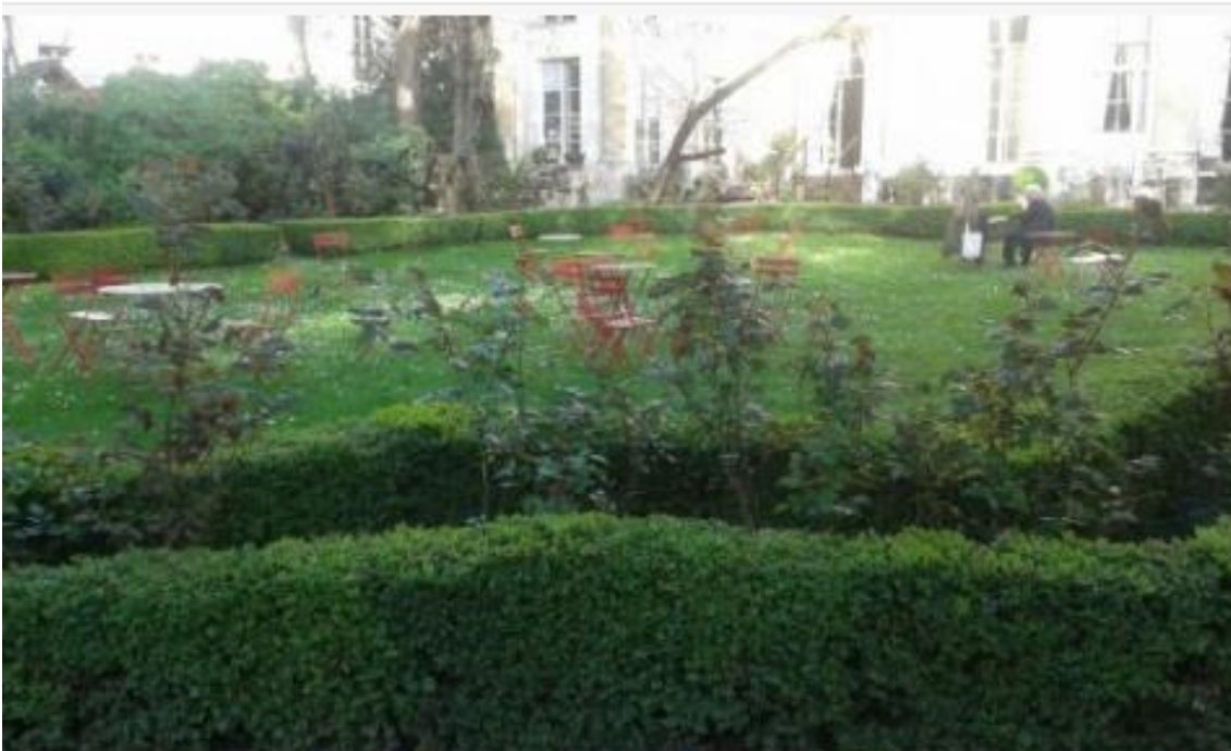
Il giardino luogo di lettura e di scambio di opinioni