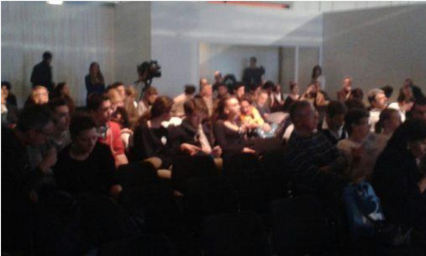
Il pubblico presente