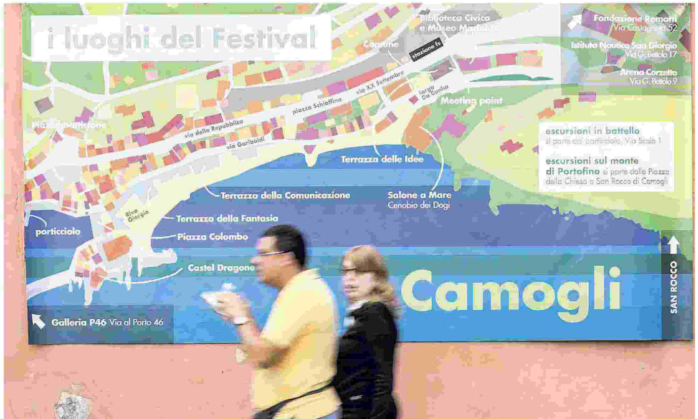
Presentata ieri a Milano la terza edizione del Festival della Comunicazione, in programma a Camogli dal 7 al 10 settembre