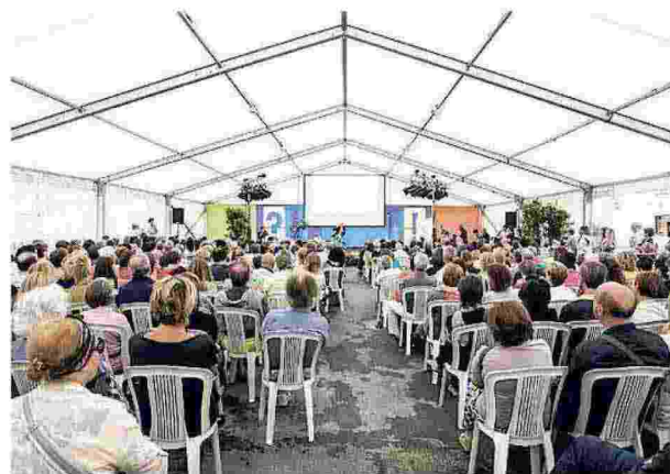
IL FESTIVAL un evento della passata edizione, sopra Camogli affollata

Ritaglio stampa ad uso esclusivo del destinatario, non riproducibile.