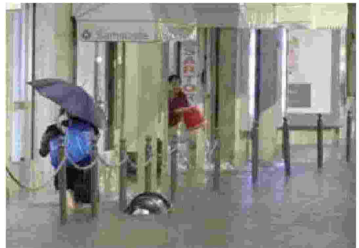
FACEBOOK A Rapallo chiuso Corso Italia per l'allagamento