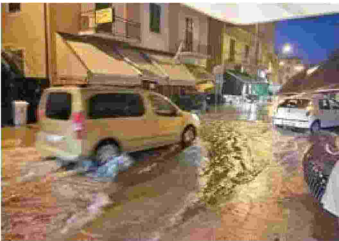
Via Piacenza a Chiavari