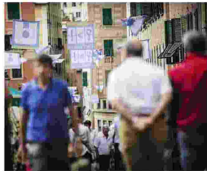
UMBERTO ECO tra gli ideatori del Festival della Comunicazione a Camogli