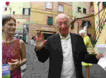
PREMIO COMUNICAZIONE a Piero Angela