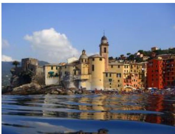
Camogli Festival della comunicazione

Si avvicinano le date della III edizione del Festival della Comunicazione , a Camogli dall'8 all'11 settembre 2016.