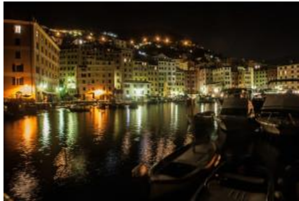
Camogli Festival della Comunicazione