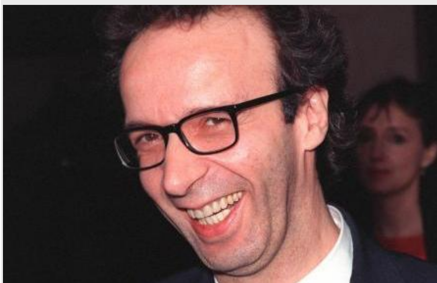
Roberto Benigni

Incontri, spettacoli, laboratori ed escursioni. Tullio Pericoli dedica una mostra a Umberto Eco. Ci sono anche Samantha Cristoforetti e Piero Angela. Dall'8 all'11 settembre