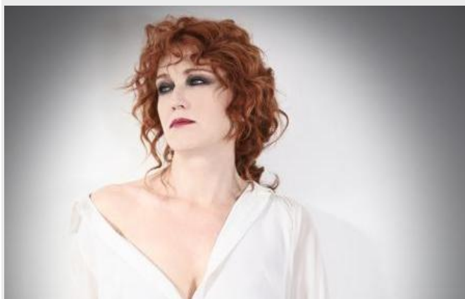
Fiorella Mannoia

Un calendario che ospita Fiorella Mannoia, Antonello Venditti, Fedez, Elio e Mario Biondi. Tornano l'Aperitivo con l'Autore e le feste di fine saldi. A giugno e a luglio