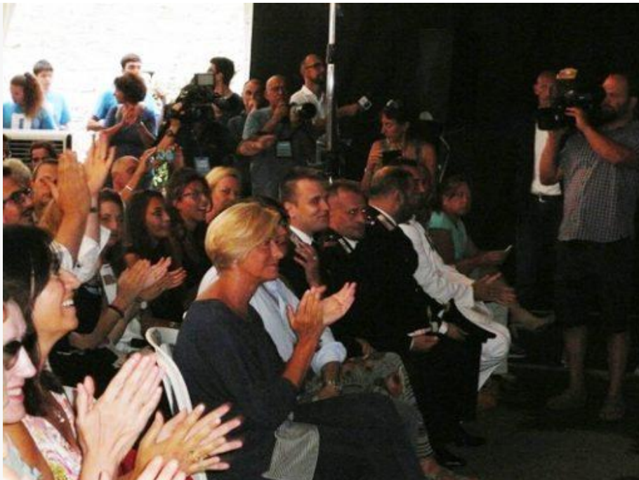
Il ministro Roberta Pinotti