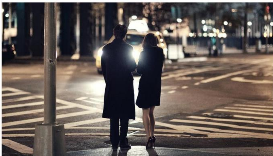
Jay McInerney, 61 anni, allievo di Carver si è rivelato nell'84 con «Le mille luci di New York»; la sua nuova trilogia, con protagonisti Corrine e Russell, comprende «Si spengono le luci» e «Good Life»

La turbolenta crisi di una coppia e di una città mentre si avvicina il ciclone della Lehman Brothers