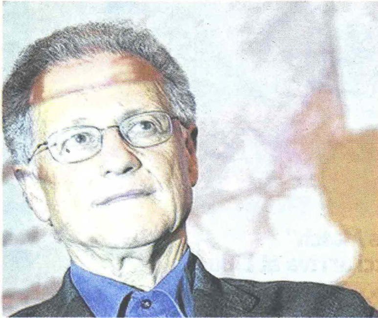
Il semiologo Paolo Fabbri, già direttore dell'Istituto Italiano di Cultura di Parigi, ha insegnato tra l'altro a Roma, Berkeley, Buenos Aires