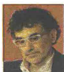
di LORENZO GUADAGNUCCI

Gli abissi di Internet non sono abitati solo dal crimine: servono a chi lotta contro le dittature