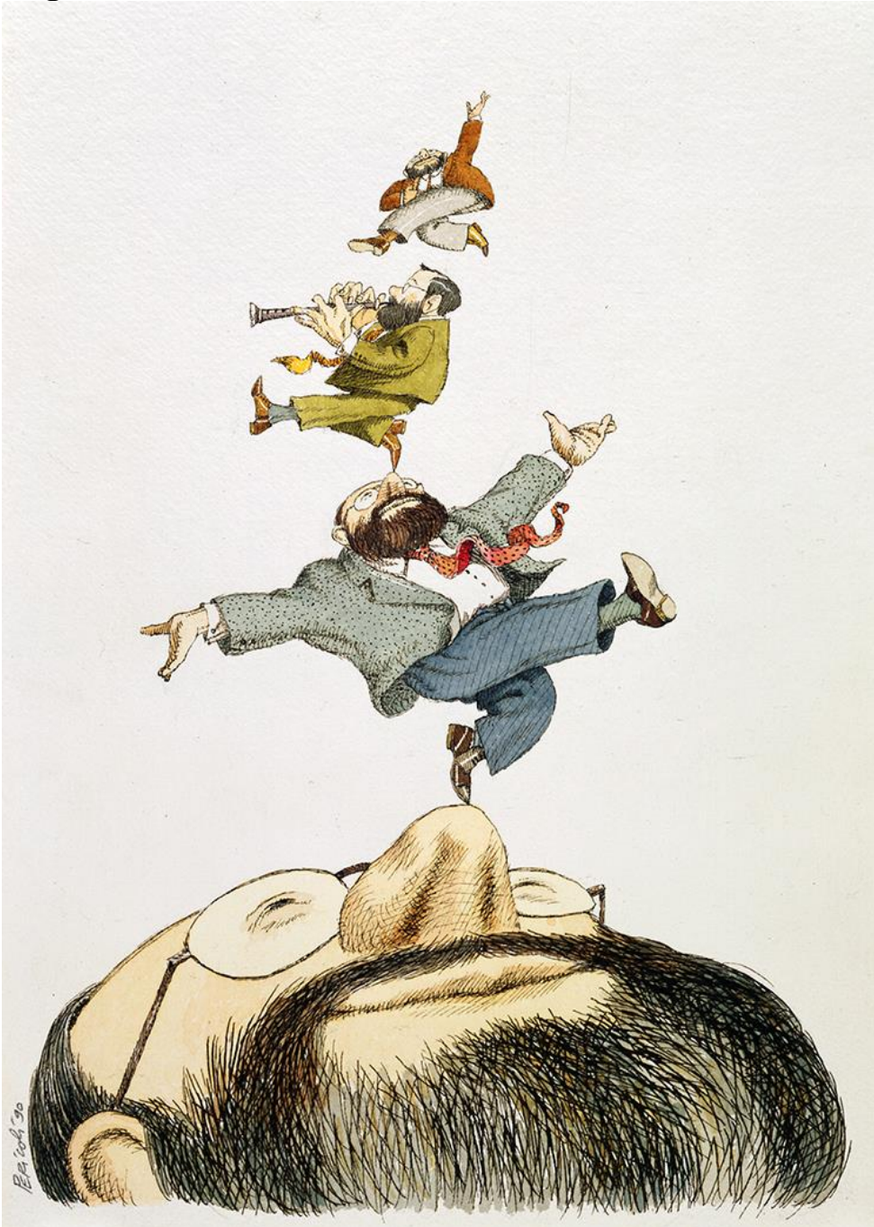
Tullio Pericoli, "Quanti ritratti, caro Umberto"