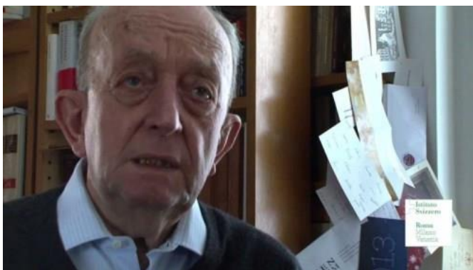
Tullio De Mauro

Dopo le oltre 20.000 presenze di pubblico dello scorso anno, il festival torna con tanti appuntamenti in cartellone e moltissimi ospiti eccellenti del mondo della comunicazione. Manager, musicisti, linguisti, scrittori, blogger, registi, psicologi, semiologi e molti altri si alterneranno infatti durante le giornate del festival e sarà proprio il semiologo per eccellenza, ovvero Umberto Eco , a chiudere la manifestazione il 13 settembre con la sua lectio magistralis dal titolo “Tu, Lei, la memoria e l’insulto” .