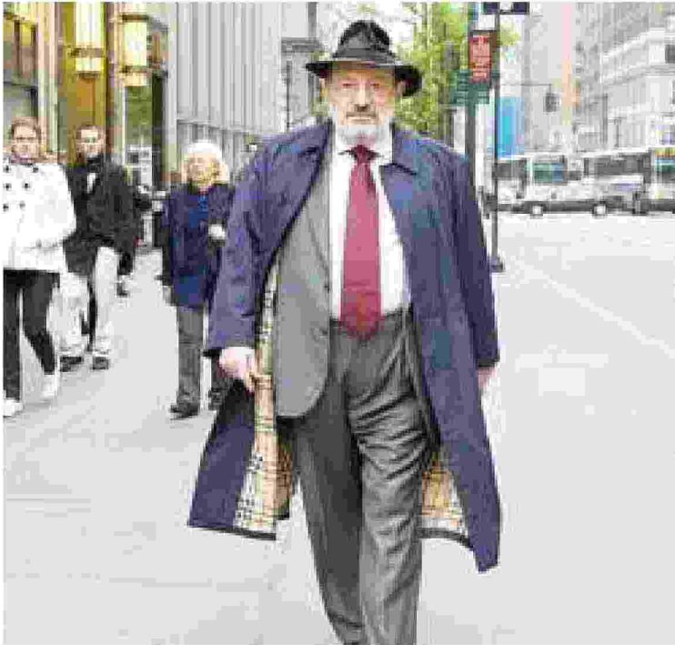
Umberto Eco terrà la lectio magistralis FESTIVAL COMUNICAZIONE