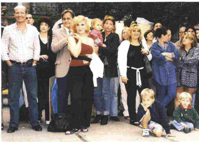
FRANCESCO JODICE BUENOS AIRES, 2001-02 STAMPA FOTOGRAFICA

A Camogli (GE) da giovedì 10 a domenica 13 settembre ritorna il Festival della Comunicazione , una manifestazione ideata e diretta da Rosangela Bonsignorio e Danco Singer, promossa da Regione Liguria e dal Comune di Camogli. Quattro giornate di conferenze, laboratori, spettacoli, escursioni in mare e mostre, con la partecipazione di circa 110 ospiti, tra esperti di comunicazione, di semiotica, blogger, manager, musicisti, linguisti, scrittori, direttori di giornali cartacei, digitali e della tv. Questa seconda edizione del festival si concentra su uno degli aspetti fondanti di ogni comunicazione: il linguaggio. Si parlerà dei cambiamenti nel linguaggio