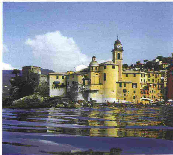
Massimo Bisio Festival della Comunicazione 2014 (2)

Un cast d'eccezione, da Eco a Settis, conferenze gratuite e uno scenario da cartolina: ed è solo la prima edizione