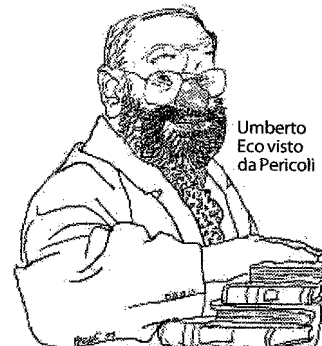
Umberto Eco visto da Pericoli