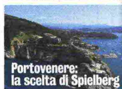
Portovenere: la scelta di Spielberg

...DA OSCAR A ds., la costa di Portovenere, frequentata da Steven Spielberg, 67 anni (più a ds.). Il regista ha lasciato 300 euro di mancia a un cameriere.