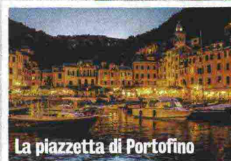
La piazzetta di Portofino

DIVI... Cate Blanchett, 45 anni, Oscar nel 2014 come Miglior attrice protagonista per "Blue Jasmine" di Woody Allen, ha girato uno spot a Portofino (a sin., la piazzetta).